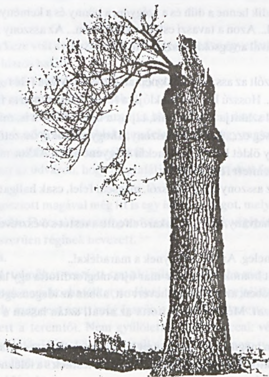
Kovács B. Sándor : Fotógrafika