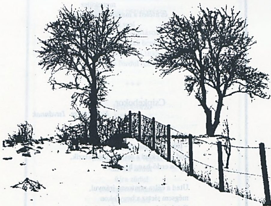
Kovács B. Sándor : Fotográfika

Bagolyirtás-Mátraszentimre-Budapest, '93. július, szeptember