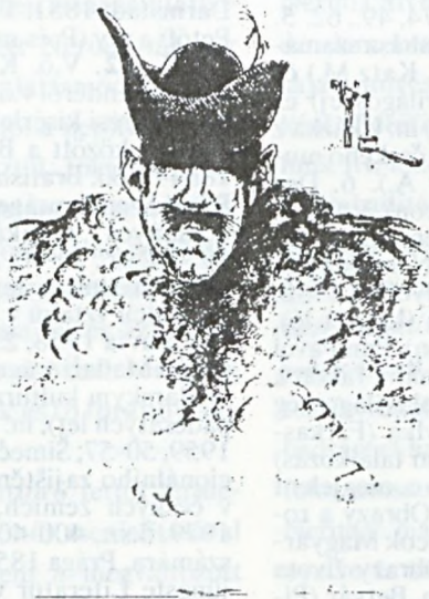
Olexa József : Grafika

mű művében közölt (Praha 1907, III.r., 2.sz., 282), miszerint Neruda a halottaknap-i tárcában lefordította Petőfi Sen o smrti c. versének egy részét. Valóban, Ha az isten... c. versről van szó a Szerelmem gyöngyei Bertának (Pesti Divatlap 1845, 2-4.sz., 751 és köv.) szerelmesvers-ciklusból, amit Mednyánszky Berta tiszteletére írt Petőfi. Petőfi Halálom c. rövid négy soros versének 1844-ből (az egyetlen ezen a címen) nincs ehhez semmi köze. 19. Básně Alexandra Petőfiho, Praha 1871, 8. Petőfi verseinek Tüma által szerkesztett gyűjteményes kiadásáról és annak előszaváról már említést tett Rákos, P.: Patří i české kultuře, in. Petőfi, S.: Blesky rozhněvané a křídla motýlí, Praha 1973, 89, 20. V.ö. Tüma, K.: O boji národa amerického za samostatnost, Praha 1871; uő.: O Jiří Washingtonovi, zakladateli svobody americké, Praha 1872; uő.: Apoštol svobody (G. Mazziniról), Praha 1873; uő.: Ze života melého národa (Belgiumról), Praha 1874; uő.: Karel Havlíček Borovský, Praha 1883. 21. Neruda, J.: Básně Petőfiho, Národní listy, 1871. dec. 17. 22. Uo. 23. V.ö. Pražák, R.: Neruduv Honvéd v Bulharsku, Slovanský přehled 44, Praha 1958, 2.sz., 127.