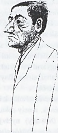
Olexa József : Grafika

szertint például Püspökharvanban 1930-ban(!) egy szlovák sem élt. Menjen oda, nézzen körül. Máig szlovákok vannak ott és szép szlováksággal beszélnek.