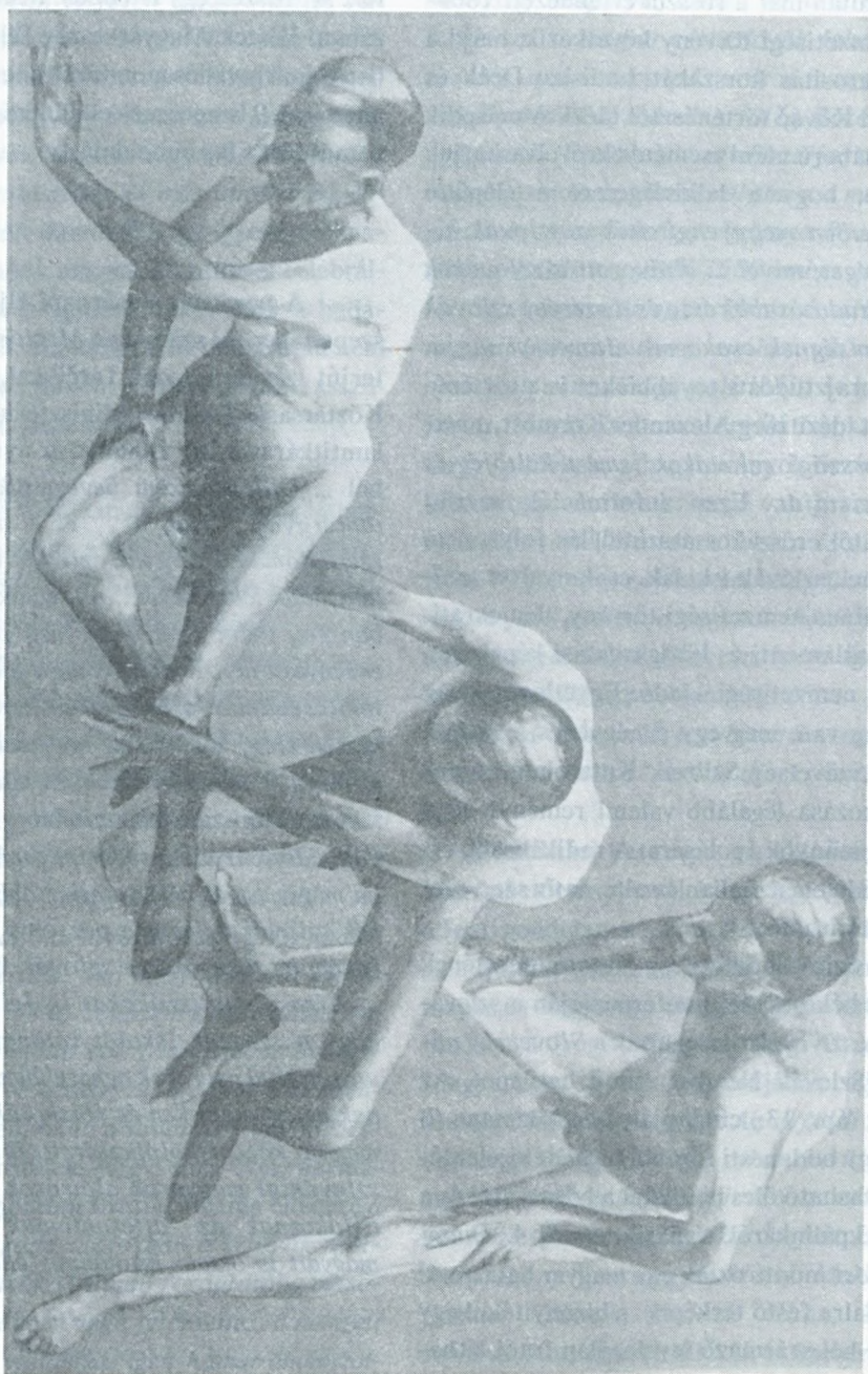
König Frigyes : Nagy alternatív (olaj)