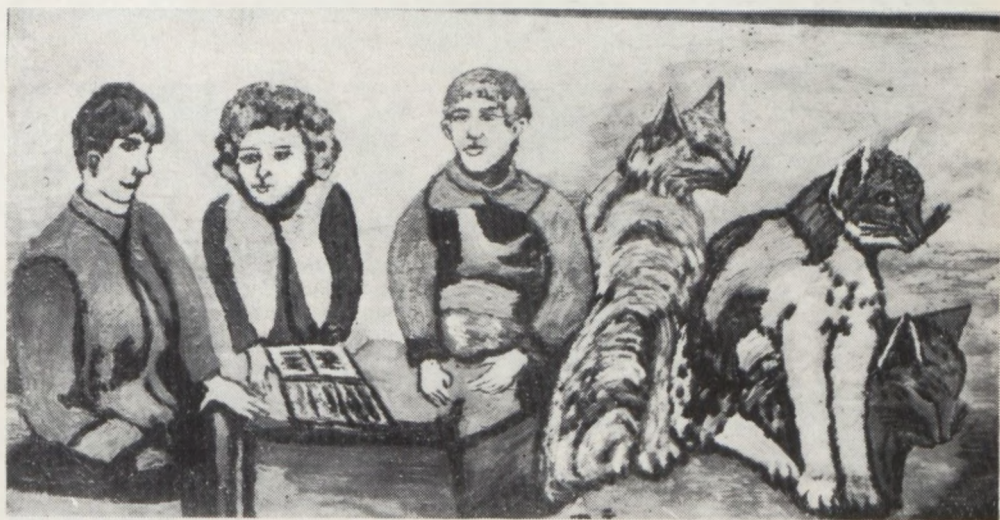
Házi barátaim 1969.