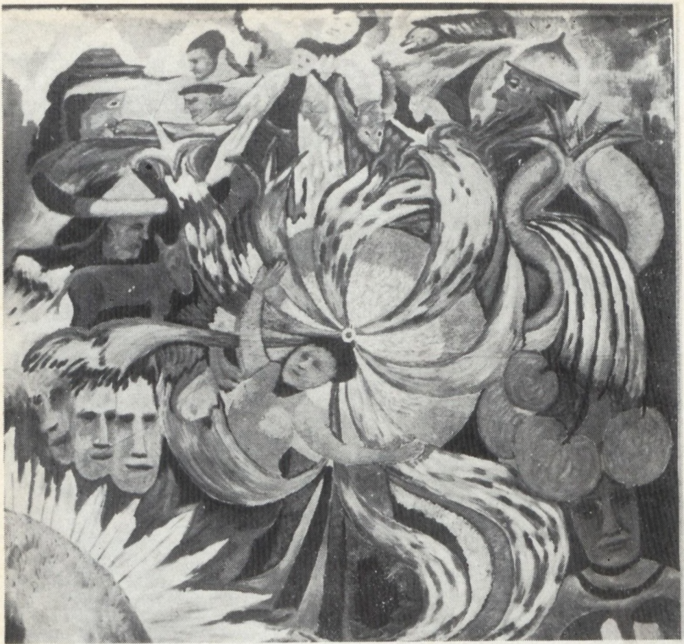
Égő világ 1971.