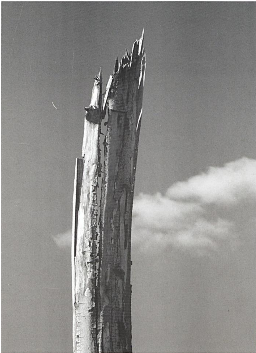
Bencze Péter: Kiszáradt fa