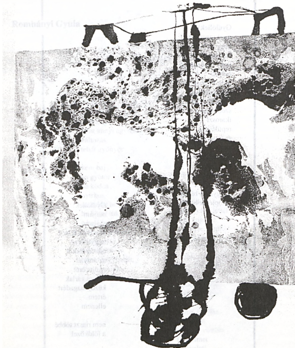
Zeke László munkája