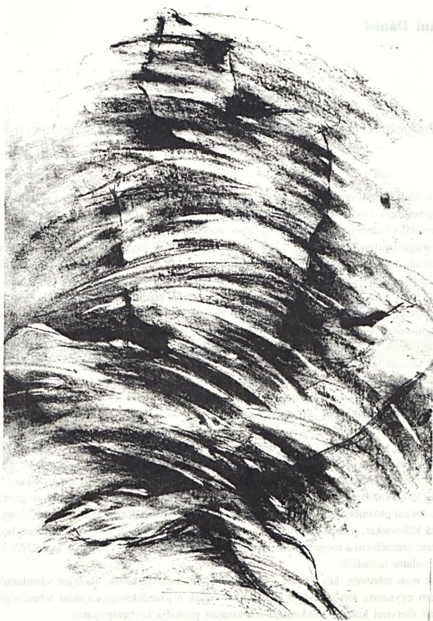
Erdélyi Eta munkája