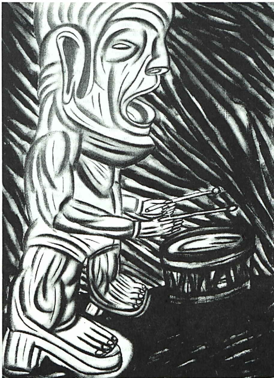
Gaál József grafikája