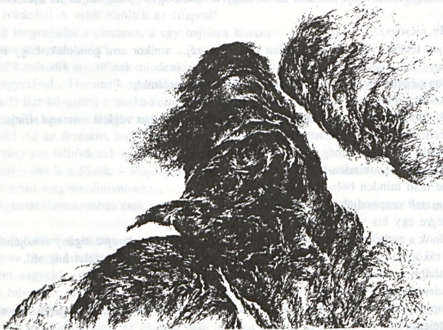
Sulyok Gabriella grafikája

(Ardamica Ferenc novellájának első része megjelent folyóiratunk XXVIII évf. /3. 209-221.)