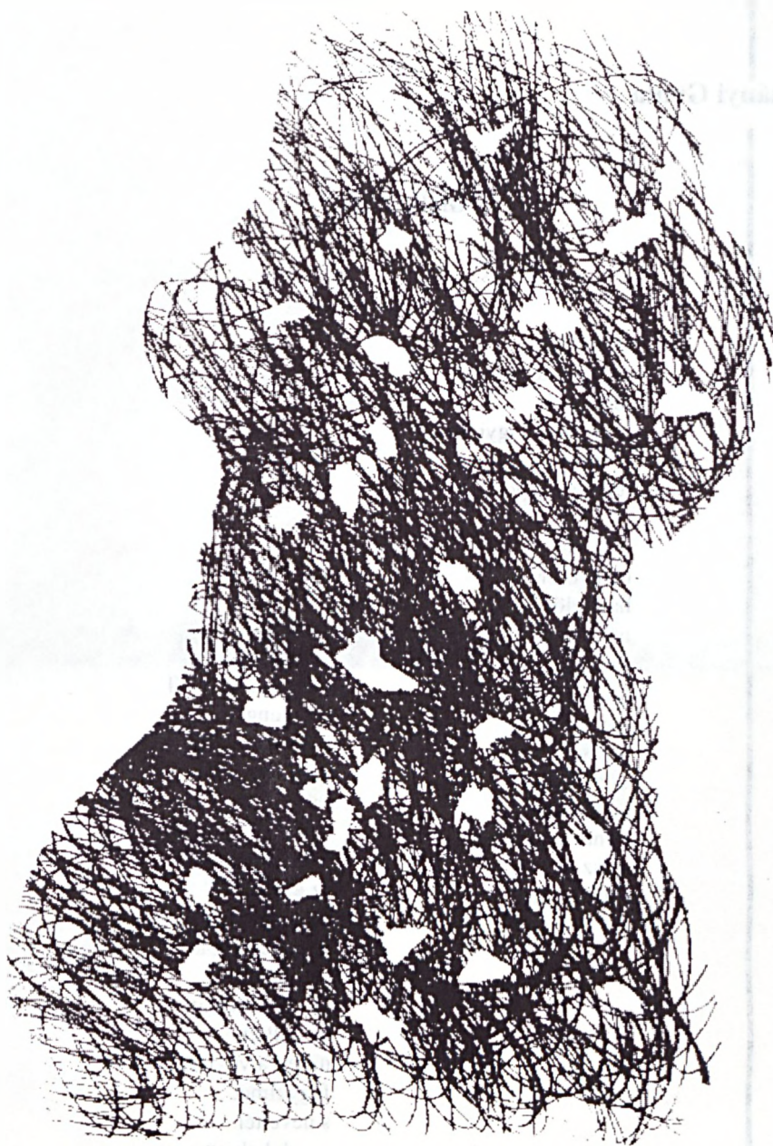
Szepessy Béla grafikája