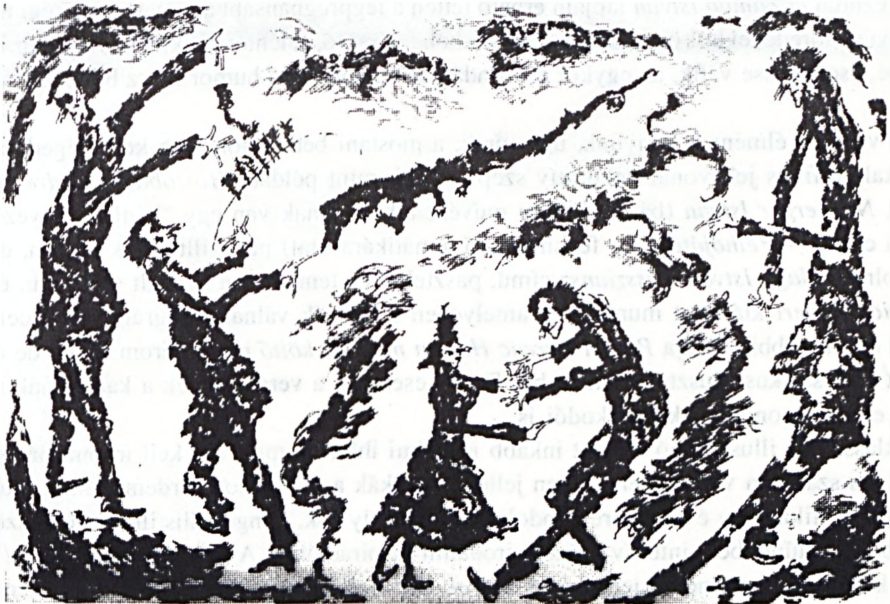
Banga Ferenc grafikája

Mégis, milyen ez a kiállítás? Egyfelől állíthatjuk, hogy színvonalas, mert, ha nem is mindig (többségükben nem) a rajz műfaján belül, de zömmel szakmailag perfekt módon létrehozott