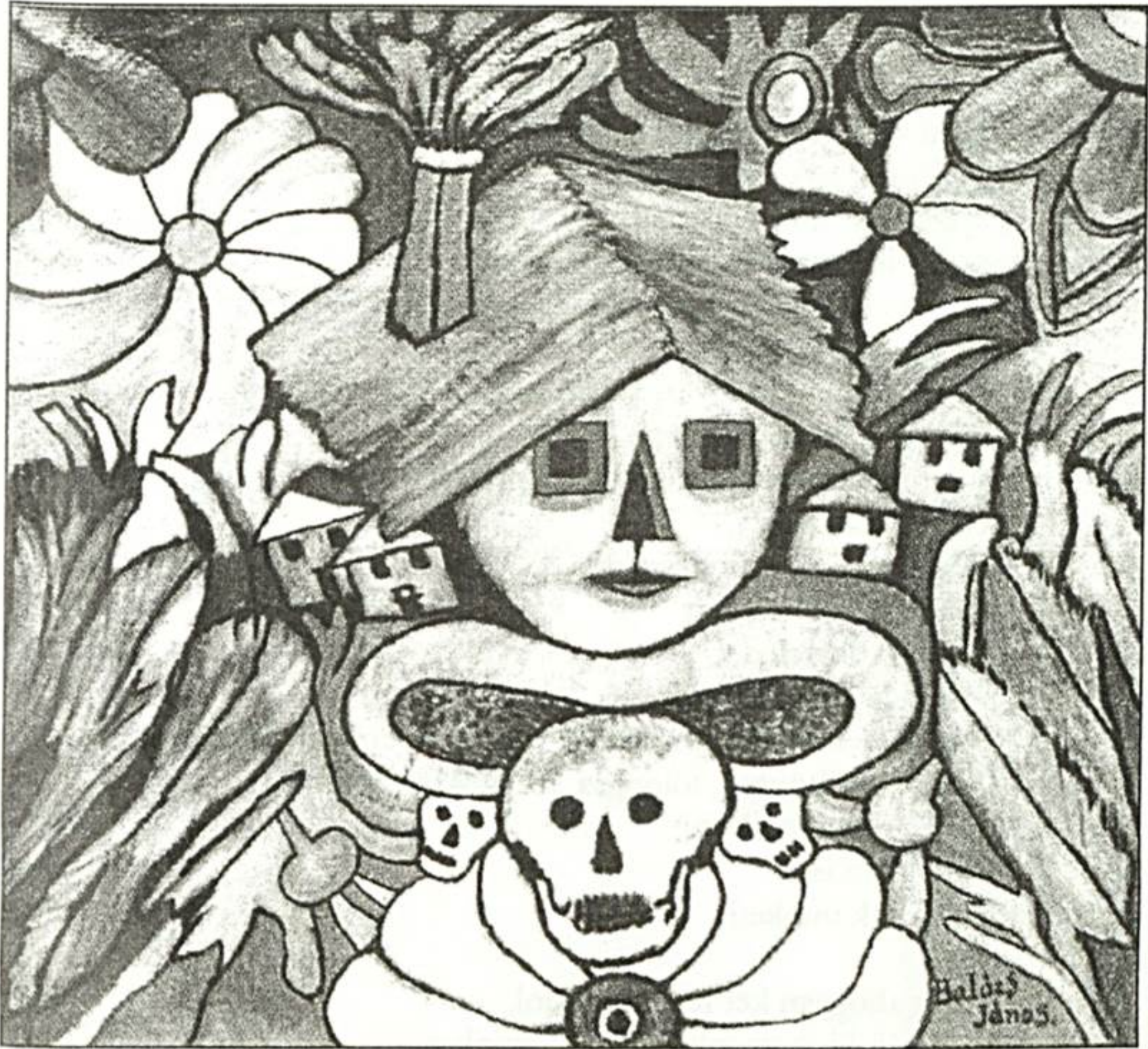
Balázs János: Házarcok koponyákkal (olaj, vászon, 61x67 cm)