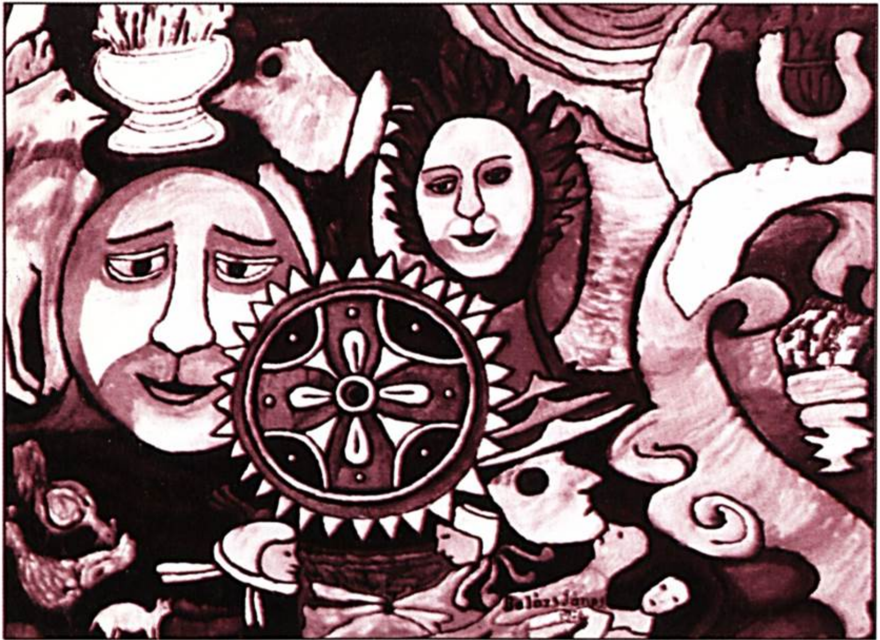
Balázs János: CIGÁNYKERÉK olaj, farost, 60×80 cm