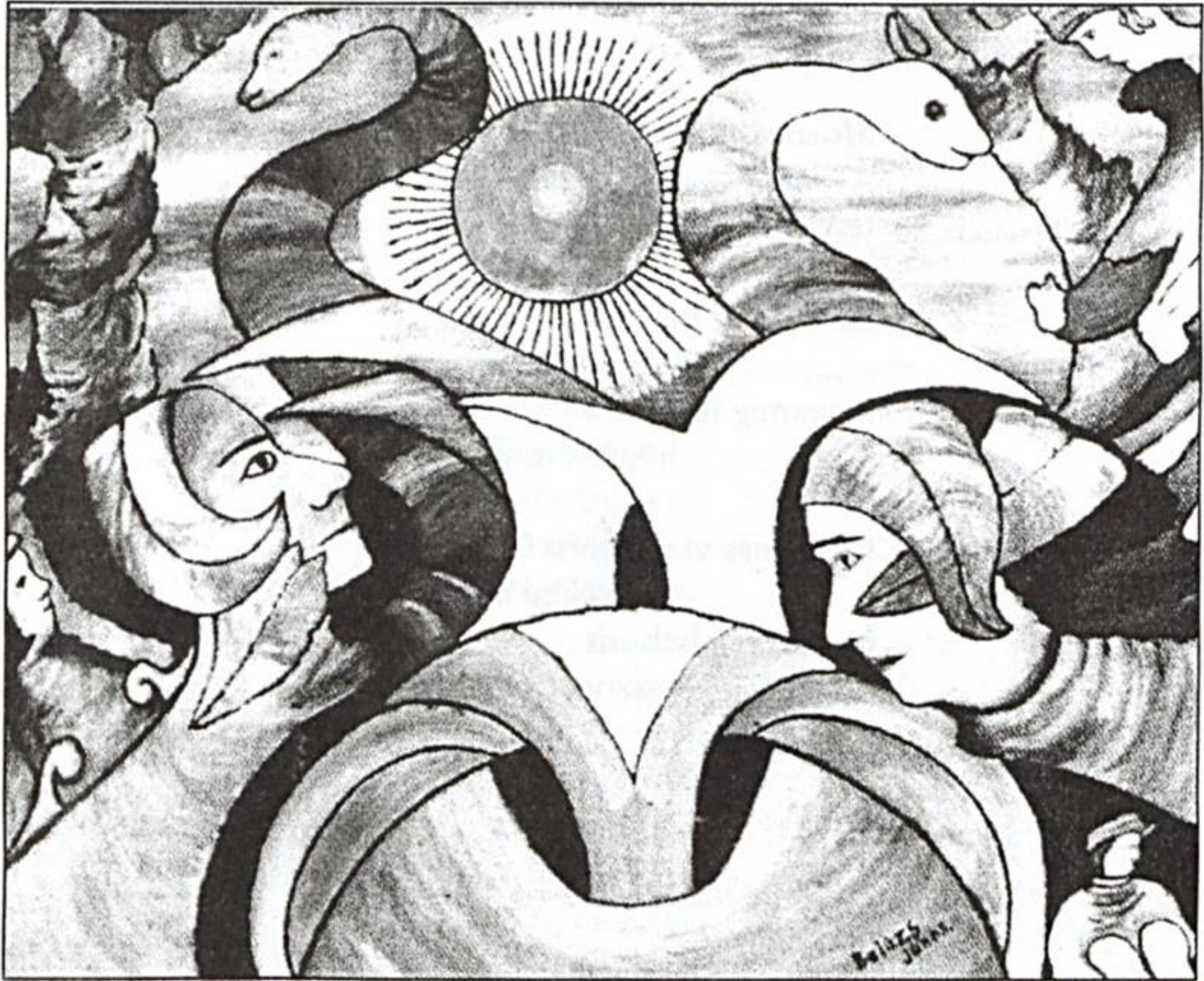
Balázs János: „A nap szerelmese” (olaj, vászon, 66x78 cm)