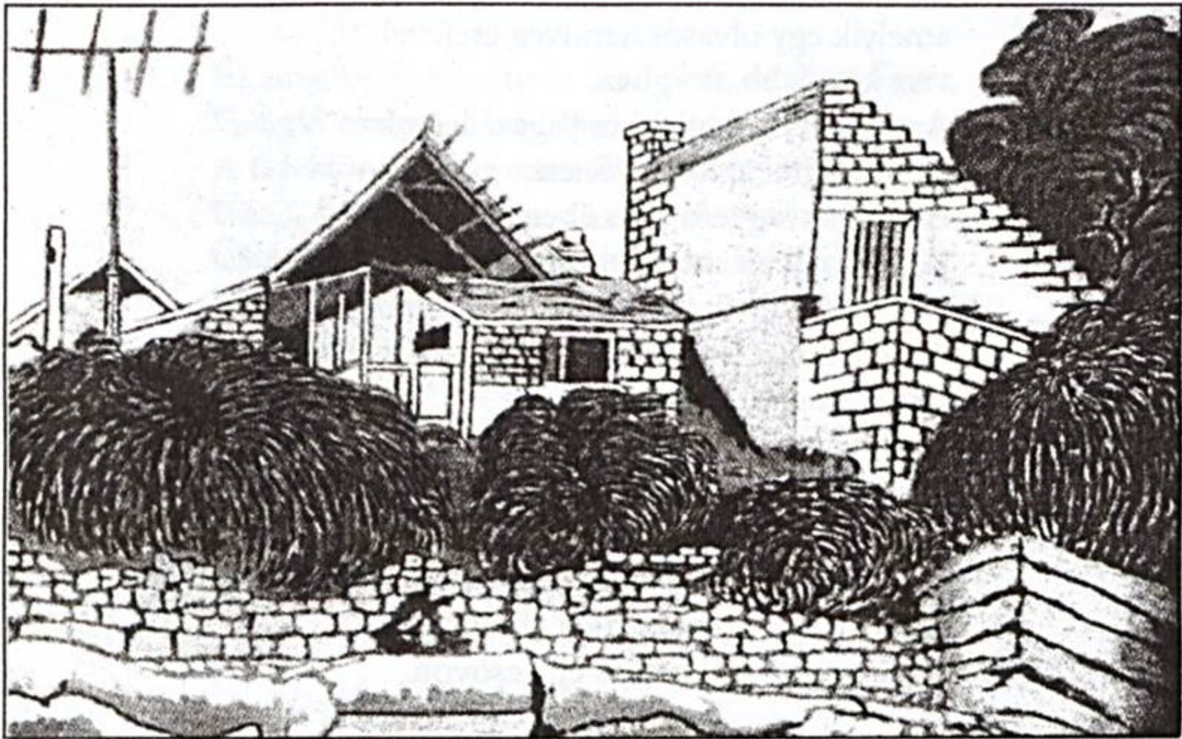
Balázs János: Pécskődomb (olaj, vászon, 39×58 cm)

A helyükön ottmaradtak a csillagok, csak a csillagok maradtak ott. Az átlók metszette pontban a hatodikos nyári szünet apró holdja. Semmi el nem vezett, olvasószemüvegem még ad is hozzá némi többletet, csillagász lettem két méter mély udvar felett, csillagász leszek két méter magas udvar alatti leshelyen, szemüvegekbe mélyedt magántörténelem.