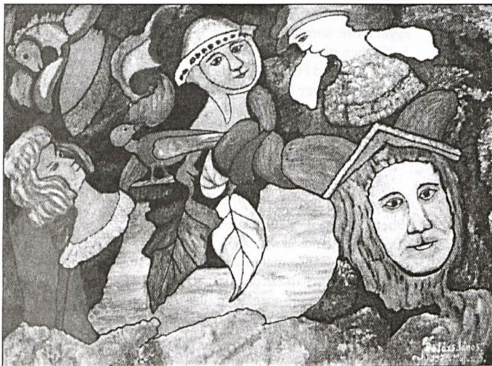
Balázs János: „Édenkert” (olaj, farost, 66,5×84,5 cm)

Kék szitakötő férceli a zengéstől felfeslett nyarat. Szoknyád színét vette fel mára, és ringásodat.