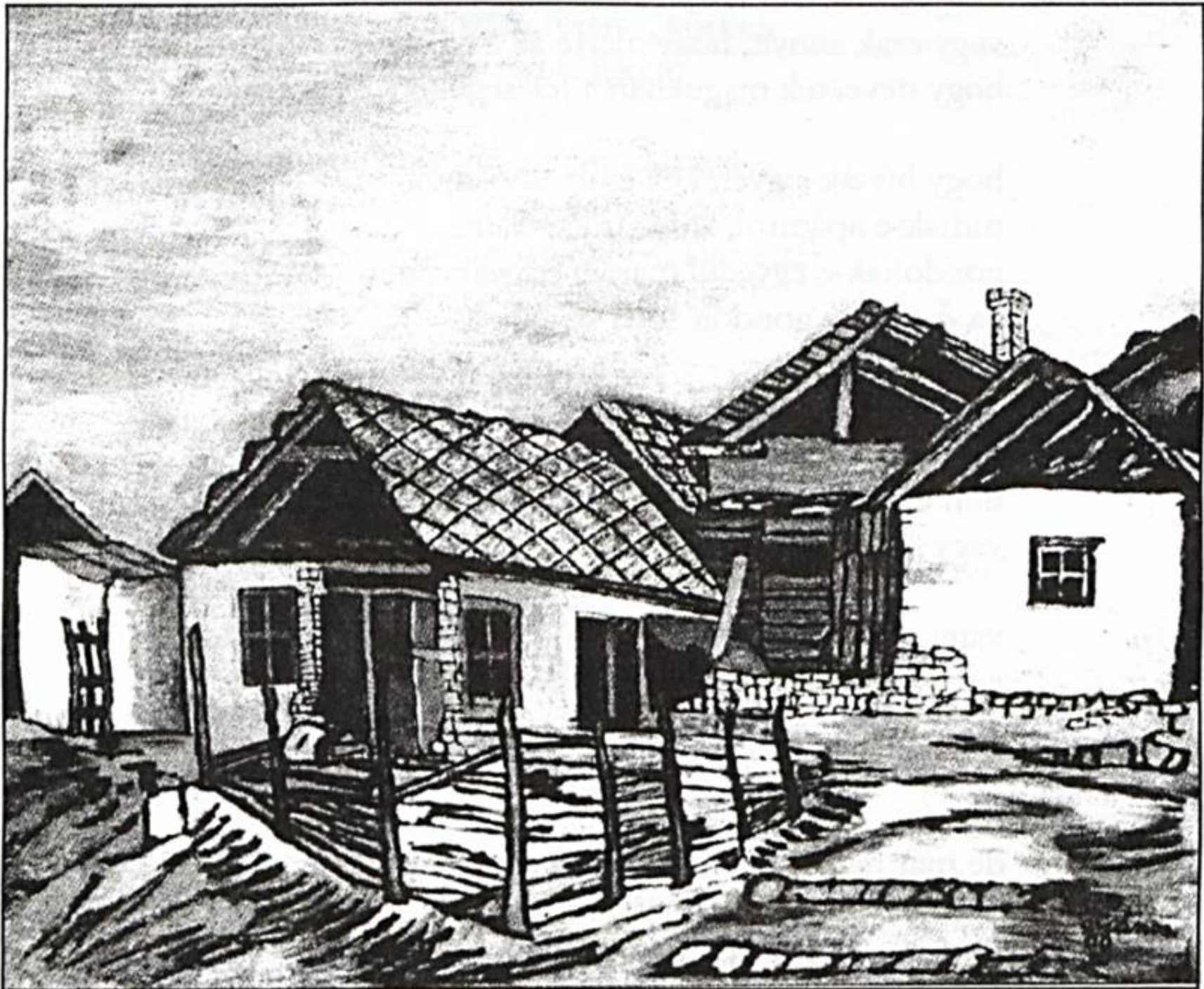
Balázs János: Pécskődombi viskók kék színben (olaj, vászon, 63×76 cm)

ha tudnék legalább néhány szónyi kincset, neveket, városokat – de nekem nem maradt ebből az ágból semmi, csak elvarratlan rokoni szálak, ismeretlen családtagok.