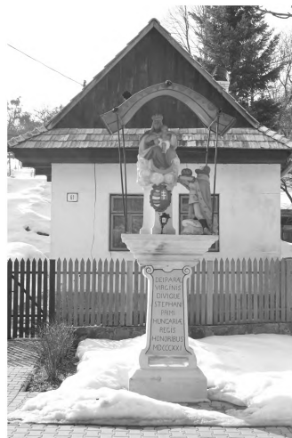
6. kép: Szent István országfelajánlása. Szoborkompozíció 1821-ből. A helyi szlovák lakosság máig jó karban tartja és tiszteletben részesíti. Berencsfalu (Preňčov, Hont vm., Szlovákia)