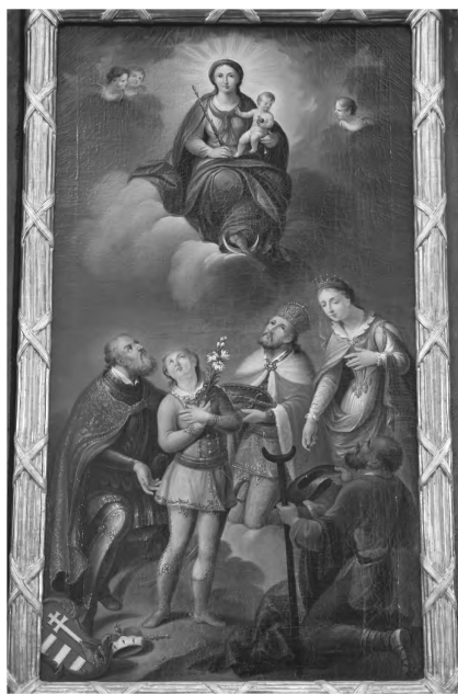
1. kép: István király és a szent magyarság országfelajánlása Szűz Máriának, Boldogasszonyunknak Nógrád község templomában

letése ünnepén bekövetkezett hősi halálával pártfogolta, szolgálta. Gróf Esterházy Miklós nádor a hazaszere-