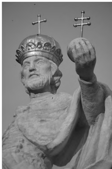
4. kép: Szent István király Mária-oszlopon Nyitra, 1750

A kulturális folytonosság értelmében is a magyarságnak hivatása, hogy hazájának az egész Kárpát-térséget tartsa. A nemzeti együvé tartozást pedig a Szent Korona motiválja, akihez mindnyájan tartozunk. István király példájával – aki úgy találta, hogy az egynyelvű nemzet gyenge –, a fentebb vázolt keresztény mentalitással bizakodva remélhetjük, hogy magyar és magyar, magyar és román, szlovák, délszláv és német, ruszin és ukrán mind összetartozunk, s egymásra számíthatunk.