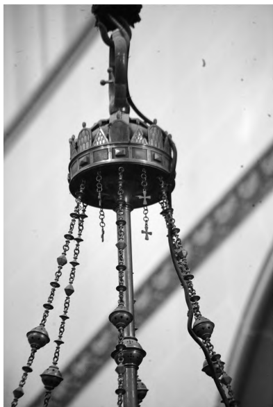
3. kép: A Magyar Szent Korona a Szent Erzsébet Székesegyház csillárelágazatójaként, mintegy a fény kibocsátójaként Kassa (Košice, Szlovákia)

lándzsába téve. Ez, a Lancea Regis, a Király lándzsája jelenik meg István ezüst dénárján, amint a szent lándzsát a mennybéli Istentől átveszi. Ezzel is a Magyar Királyság, a haza mennybéli kötődése és szabadsága hangsúlyozódott a német vagy esetleges vatikáni hűbérúri törekvésekkel szemben. A királyi tisztség legitimitásához szükséges volt az előd hatalmi jelvényeinek birtoklása. István király birtokolta Krisztus hatalmi jelvényeit, és angyaloktól küldött koronája volt. Ezek és a keresztény királlyá avató szertartás által bevattatott Krisztus királyságába és hatalmába. Ez a király szelíd és alázatos szívű, szolgálattevő, miként megmossa tanítványai lábát, és magára veszi mások terheit-bűneit olyannyira, hogy megváltja őket azoktól.