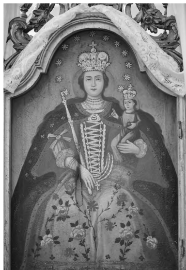
2. kép: Magyarok Nagyasszonya hordozható kép. Szent Péter-Pál plébániatemplom, Bercel (Nógrád m.)

verje sors keze, élnie és halnia itt kell. 12 E felfogást képviseli a vallási mintára Nemzeti Ereklénynek nevezett irredenta emlék is, amely a hatvanhárom egykori magyarországi vármegye „vérrel, verejtékkal áztatott” földjéből őriz néhány porszemet. A föld pecsét alakú tartóban található, előlapján az integer Magyarország áttört, üvegezett képe. A pecsét fölött „1000 éves jussunk, igazságunk megszentelt pecsétje ez” felirat, körülötte: „Ez a föld melyen annyiszor apáid (sic!) vére folyt.” 13 A másik fő hazafias műre és nemzeti jelképünkre, a Himnuszra utalva világos, hogy szintén mindenkor az egész Kárpát-medence az a terület, amelyen annyiszor támadt tenfiad szép hazám, kebledre, s lettél magzatod miatt magzatod hamvvedre. Kőlcsey Ferenc műve előtt a katolikus magyarság néphimnusza a Boldogasszony