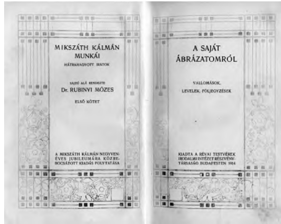
5. A Hátrahagyott iratok első (a Mikszáth Kálmán munkái 33.) kötetének belső címlapja (a kötetben Rubinyi Mózes többször idézett előtanulmányával)

Mikor aztán soká ülnek, Búsan, némán egymás mellett, Megszólal a magyar vezér: „Ne cseréljünk nyugóhelyet?”