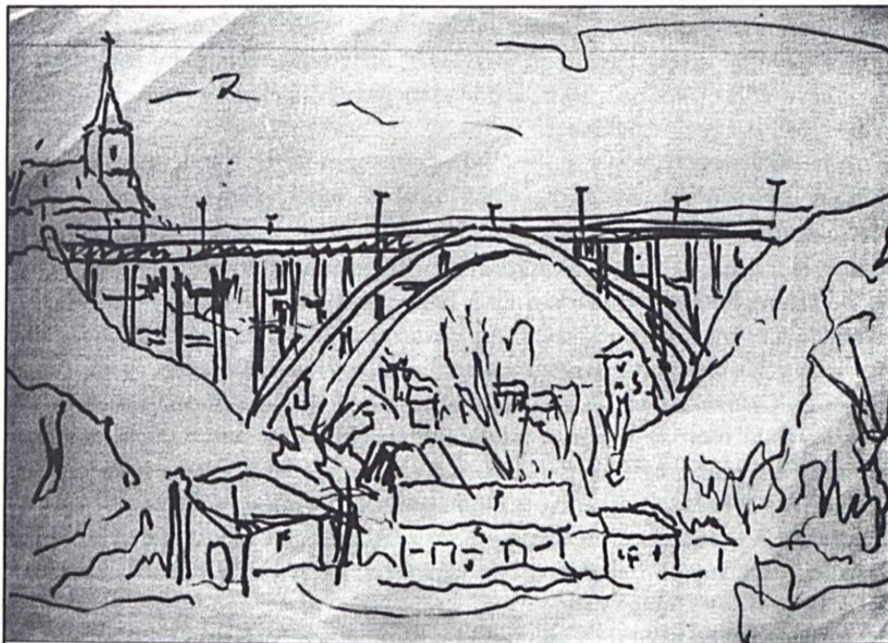
Bojtor Károly: A Völgyhíd Veszprémben

(Prágai Tamás: Sötétvilágos [versek 1996–2001] , FISZ Könyvek, 2002, 90 oldal, 1200 Ft.)