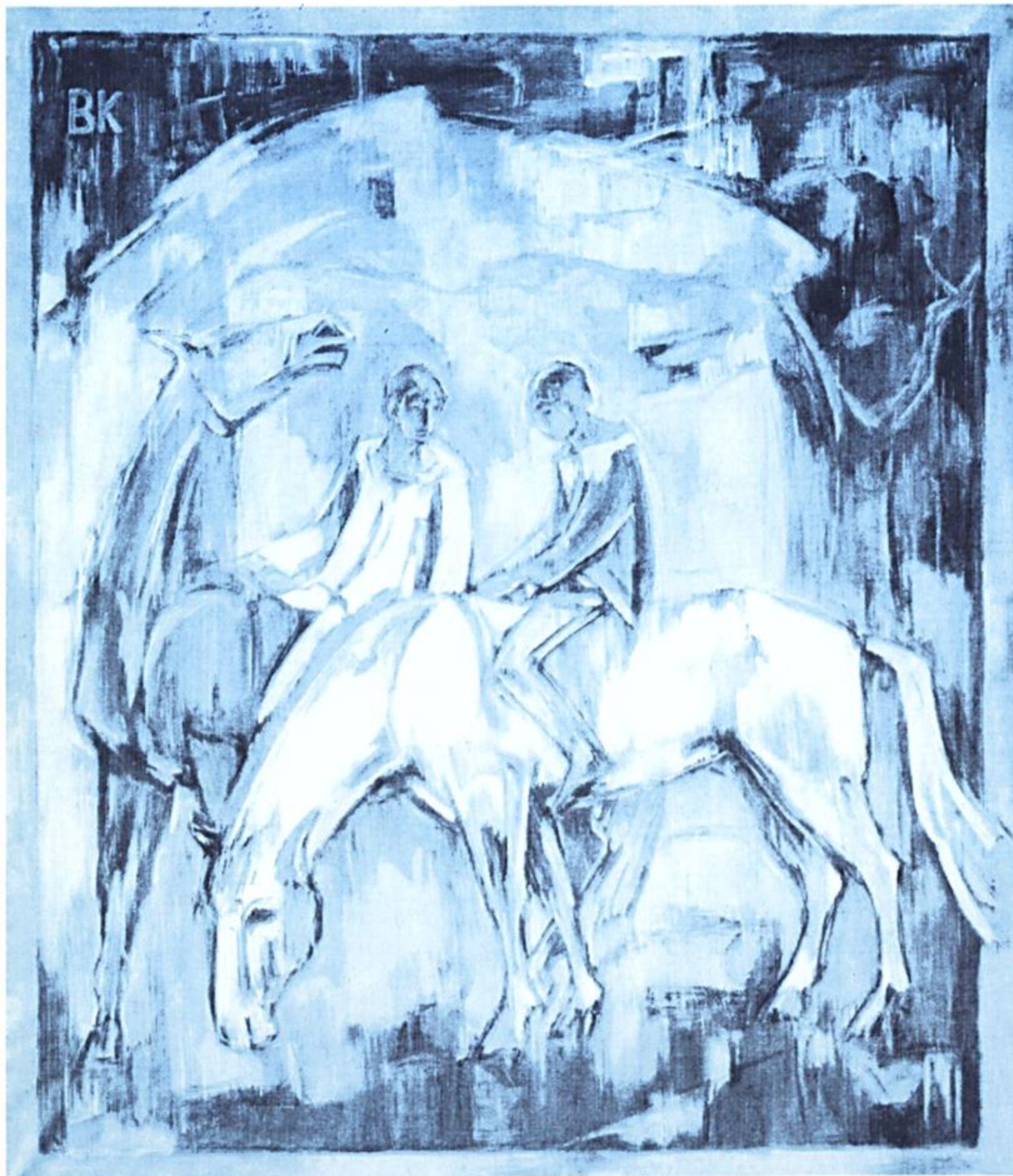
Bojtor Károly: LOVASOK 1997, gobelinkarton, vegyes technika, 145x124 cm