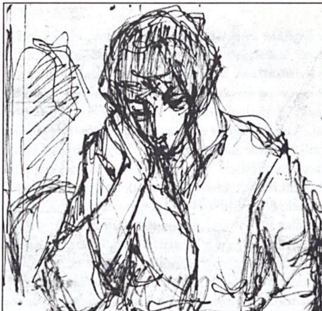
Bojtor Károly: Gondolkodó