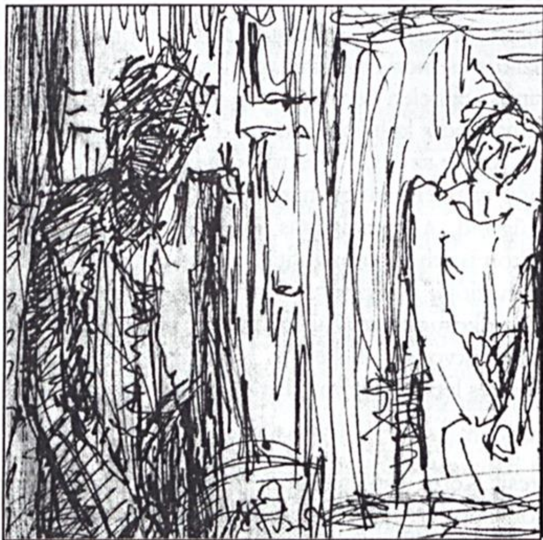
Bojtor Károly: Tükrös vázlat