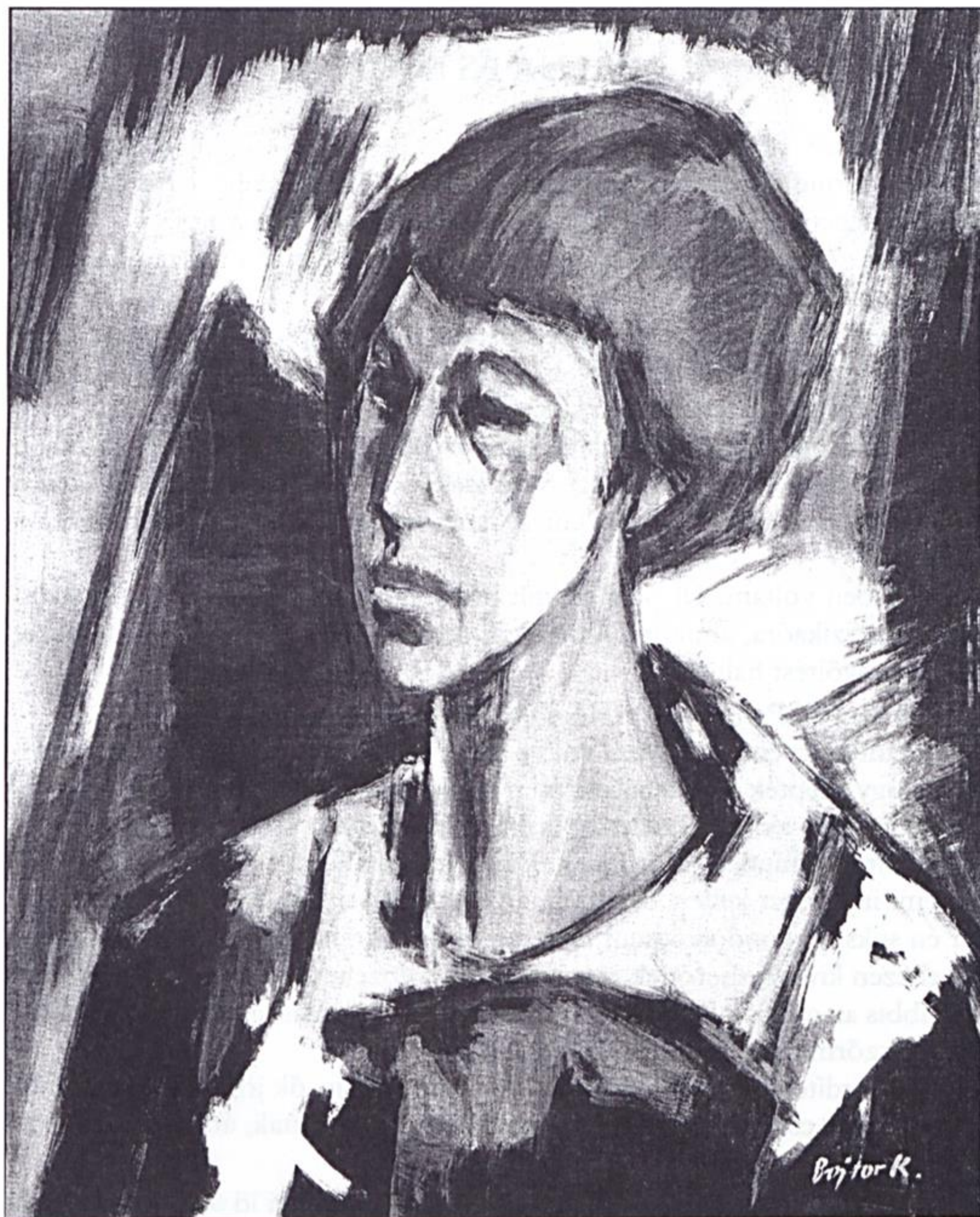
Bojtor Károly: Márta (1969)