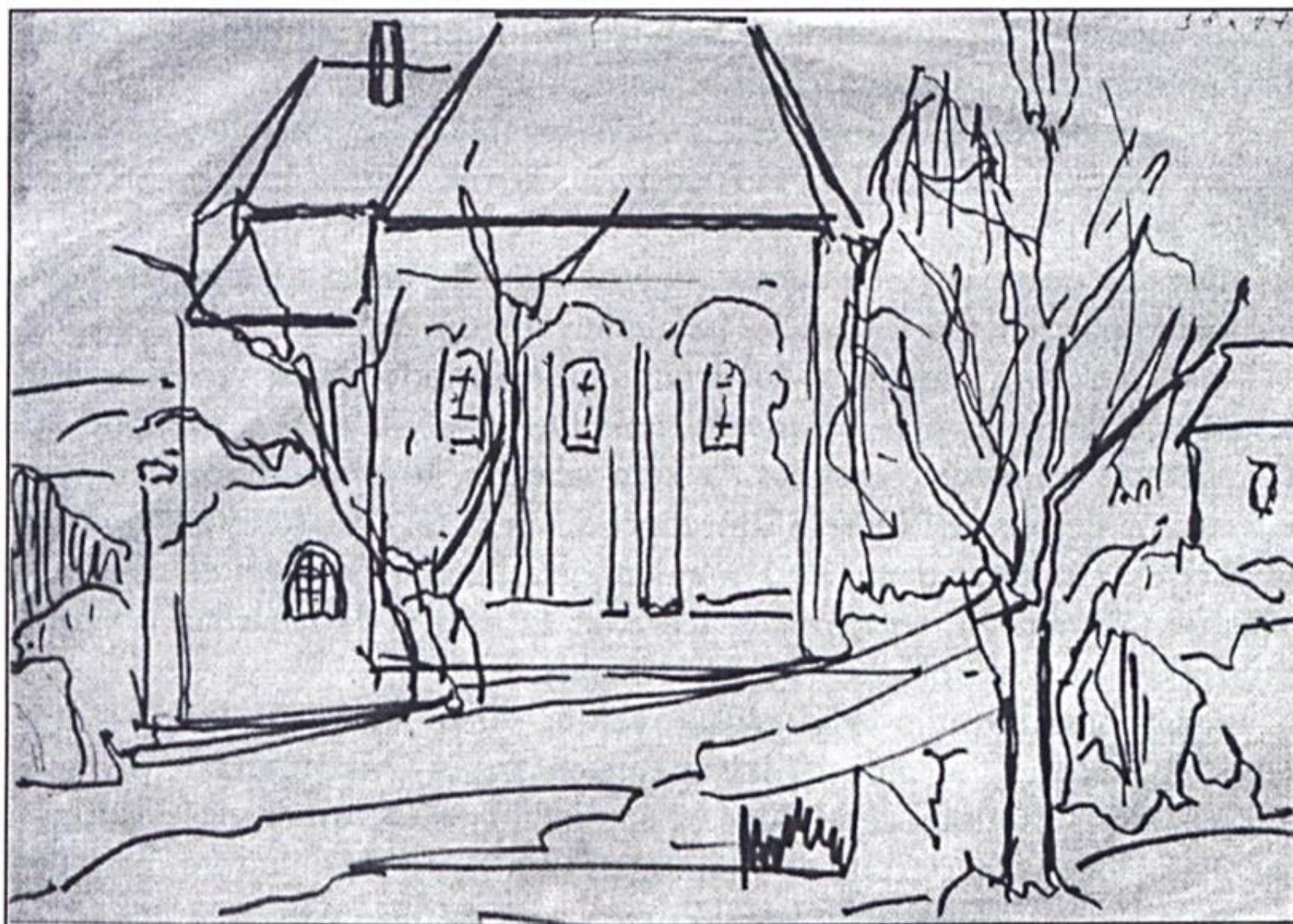
Bojtor Károly: Műemlék kápolna

Elolvasva, újraolvasva Kozma Dezső Madáchról szóló írásait, kijelenthetjük: helyes volt egy helyre gyűjtve megörökíteni azokat, hiszen sajátos, eredeti szempontokkal, úgymond határainkon túli látásmóddal gazdagítják az egyébként sem szegényes Madách-irodalmat, mint ahogyan ezt teszik az új Palócföld Könyvek Madách-kötetei is.