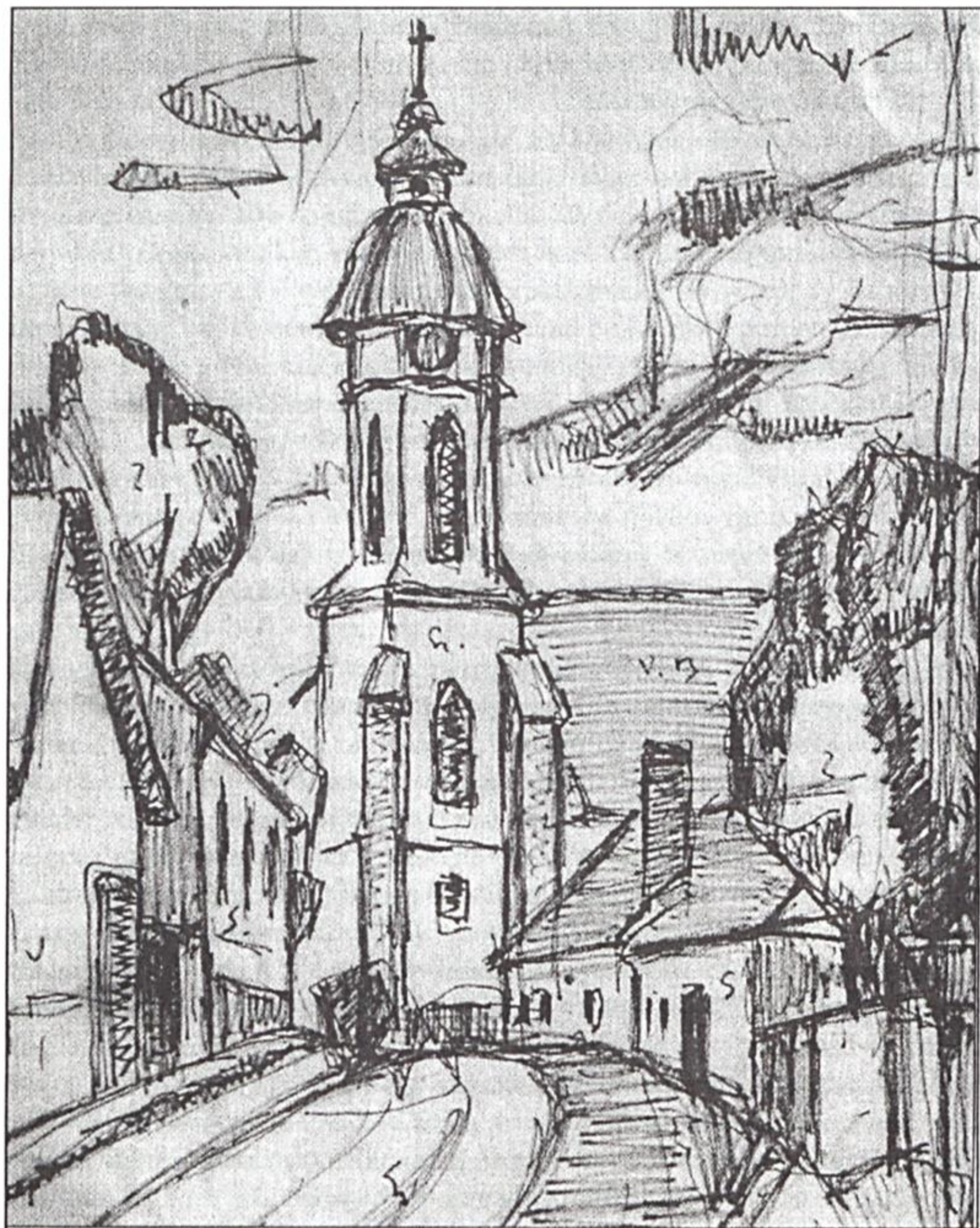
Bojtor Károly: Nagymaros