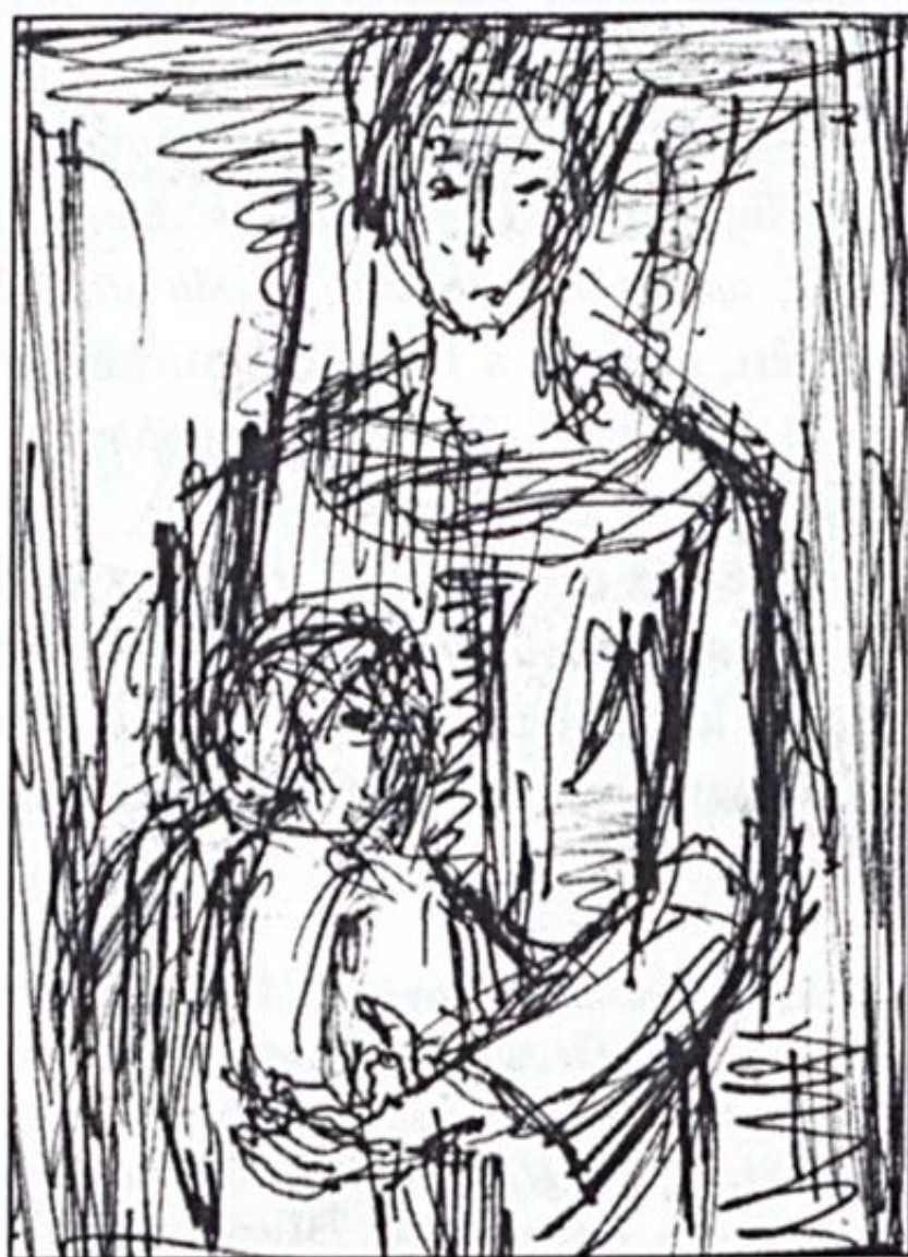
Bojtor Károly: Anyaság