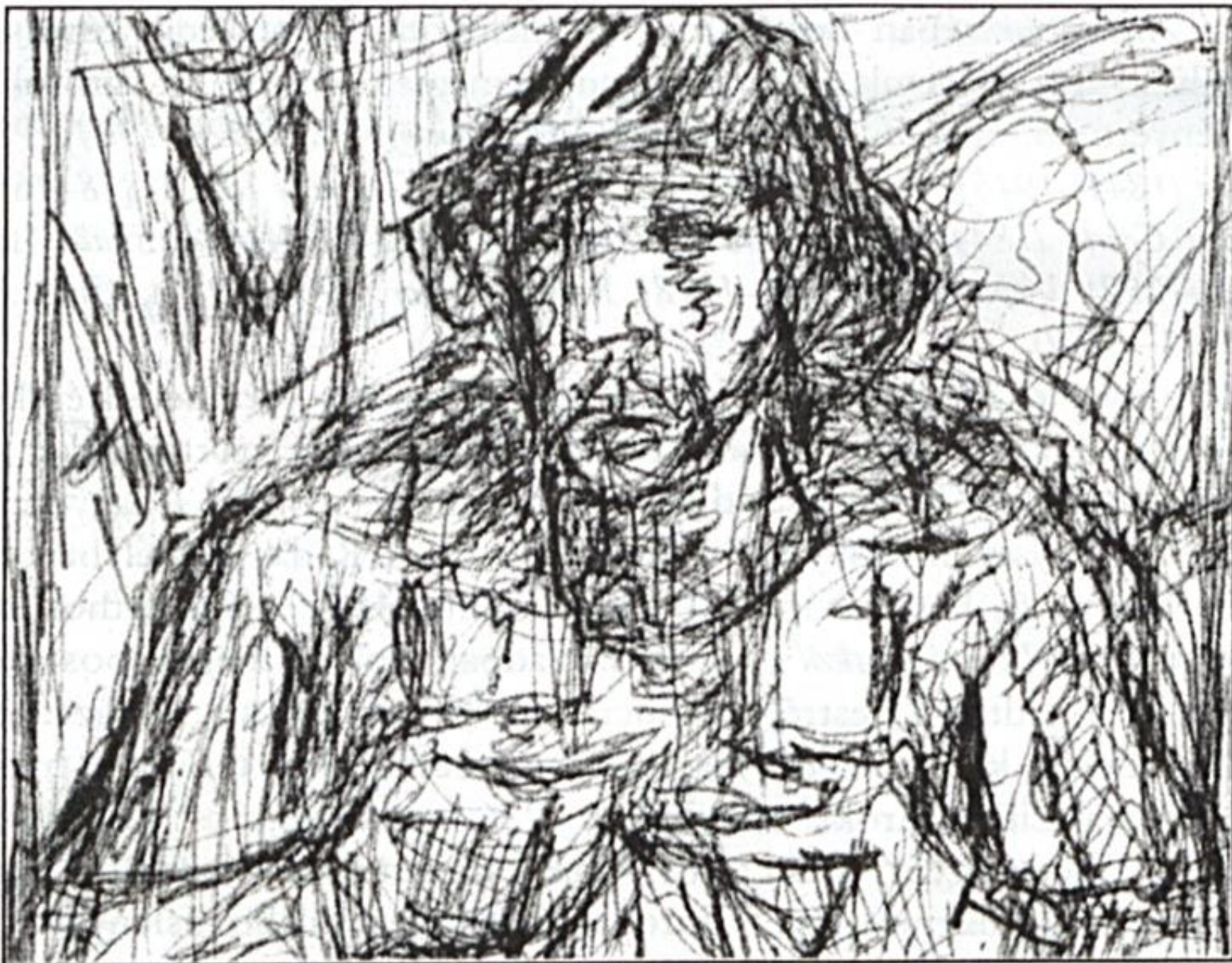
Bojtor Károly: Halászfaj vázlat

Ez a könyv nekem, az idegen olvasónak igaz örömet, kellemes tanulást (is) jelentett, a helytörténetírásnak pedig – úgy gondolom – komoly gazdagodást, Nógrád megyében.